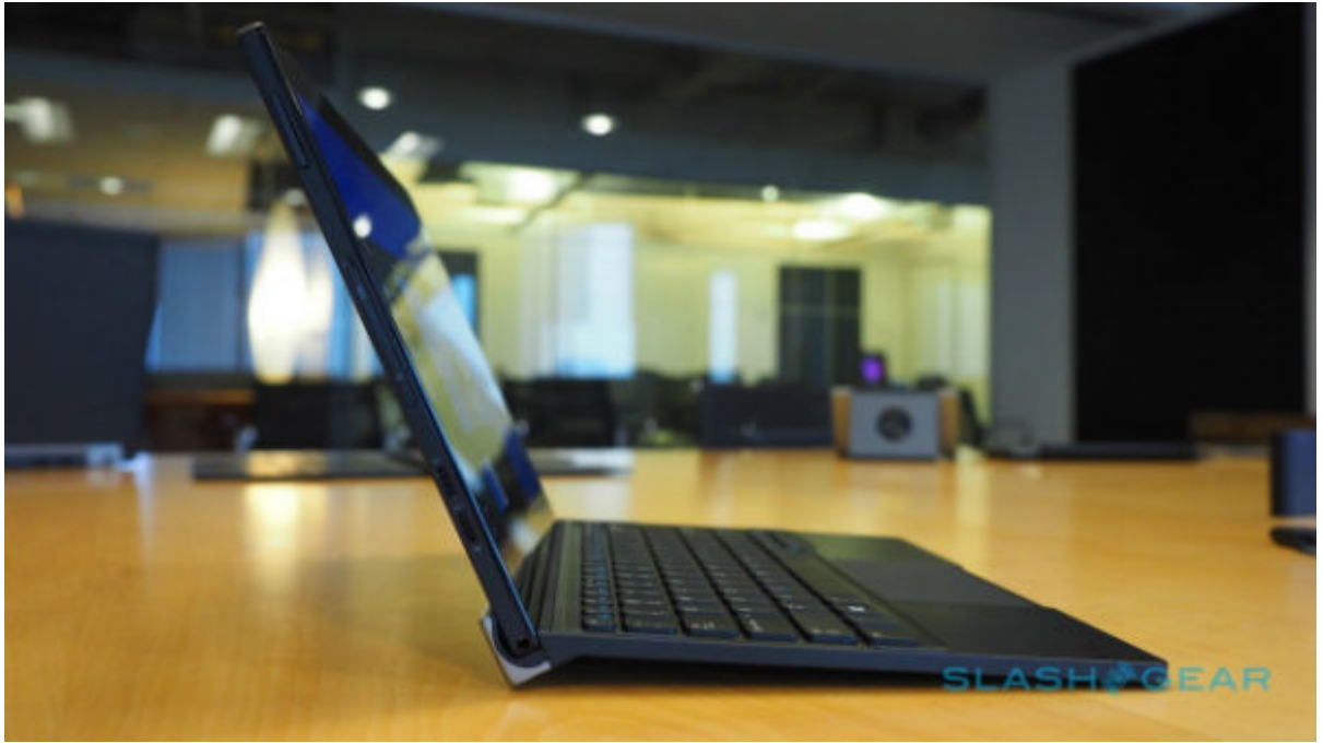
Latitude 11 5000