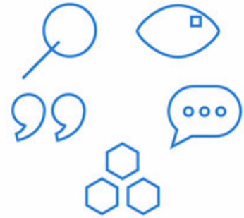
Complete workflow with Microsoft AI