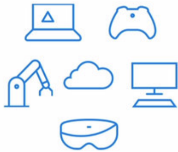
AI platform for Windows developers