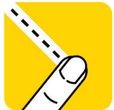
Cut It: Brain Puzzles ▪

رابط کاربری ساده و زیبا، معماهای زیاد، روان بودن گیم پلی و موسیقی مناسب با فضا همگی باعث شده‌اند تا Cut It با وجود اینکه حرکت روبه‌جلویی برای سبک خودش نباشد اما به هدفش برسد و امتیازات خوبی از بازیکن‌ها بگیرد. بنابراین اگر به این عناوین علاقه دارید و به دنبال یک تجربه جدیدتر هستید، Cut It Brain Puzzles همان عنوانی است که باید همین الان به سراغش بروید.