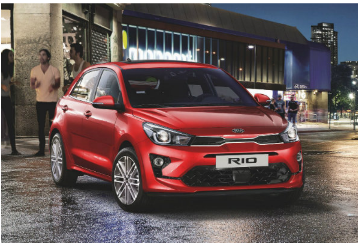
کیا ریو بعد از فیس‌لیفت

در داخل کابین هم دامنه تغییرات محدود است. اضافه شدن نمایشگر لمسی 8 اینچی به داشبورد