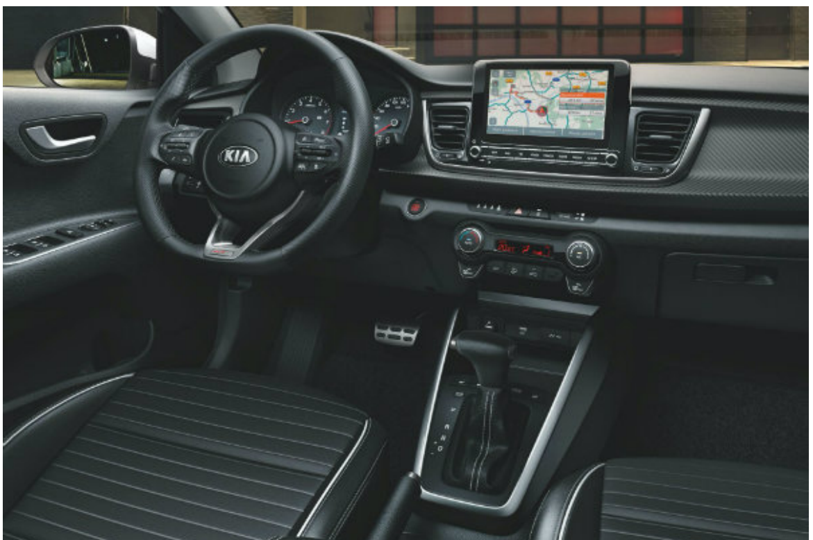
کابین ریو بعد از فیس‌لیفت