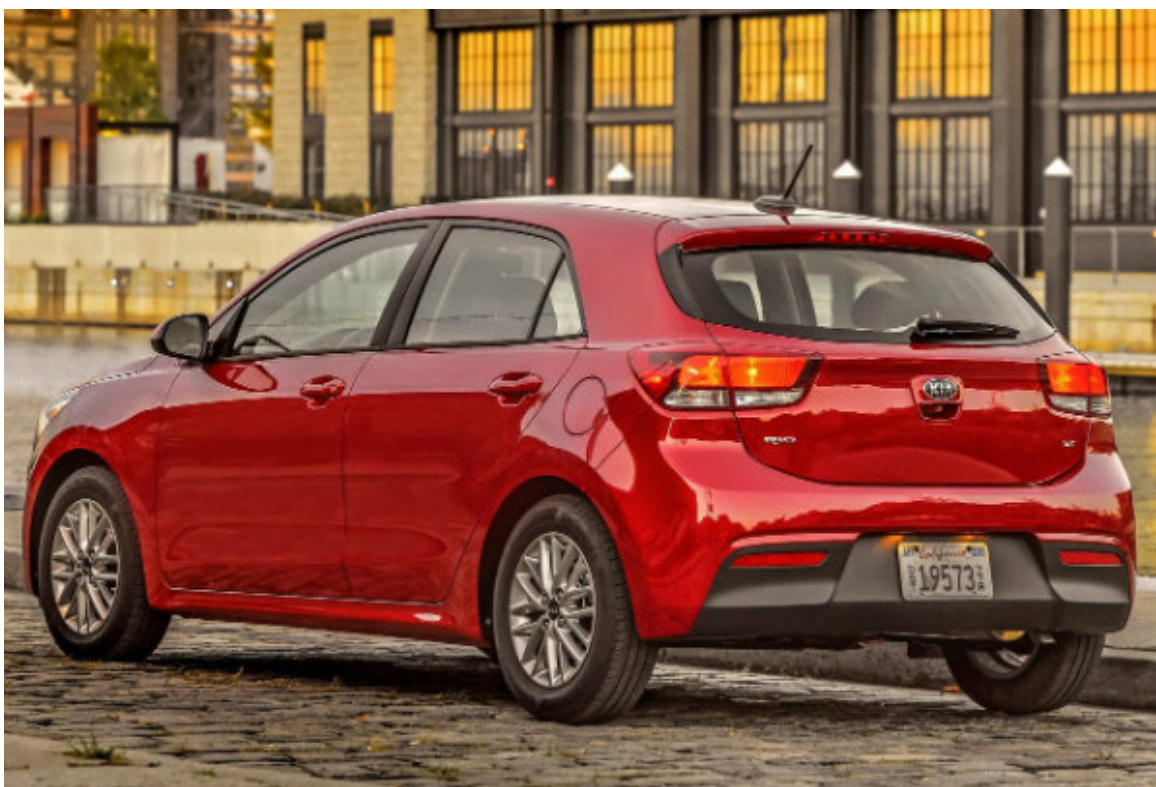
کیا ریو قبل از فیسلیفت

فیسلیفت ریو اولین محصول شرکت کیا محسوب می‌شود که با پیشرانه مجهز به سیستم هیبرید نرم (MHEV) به فروش خواهد رسید. این پیشرانه EcoDynamics+ نامگذاری شده و از ترکیب موتور یک لیتری سه سیلندر توربوشارژر و سیستم 48 ولتی به وجود آمده است. کیا ادعا می‌کند پیشرانه EcoDynamics+ میزان دی‌اکسیدکربن خارج شده از اگزوز ریو 2021 را بین 8.1 الی 10.7 درصد کاهش می‌دهد.