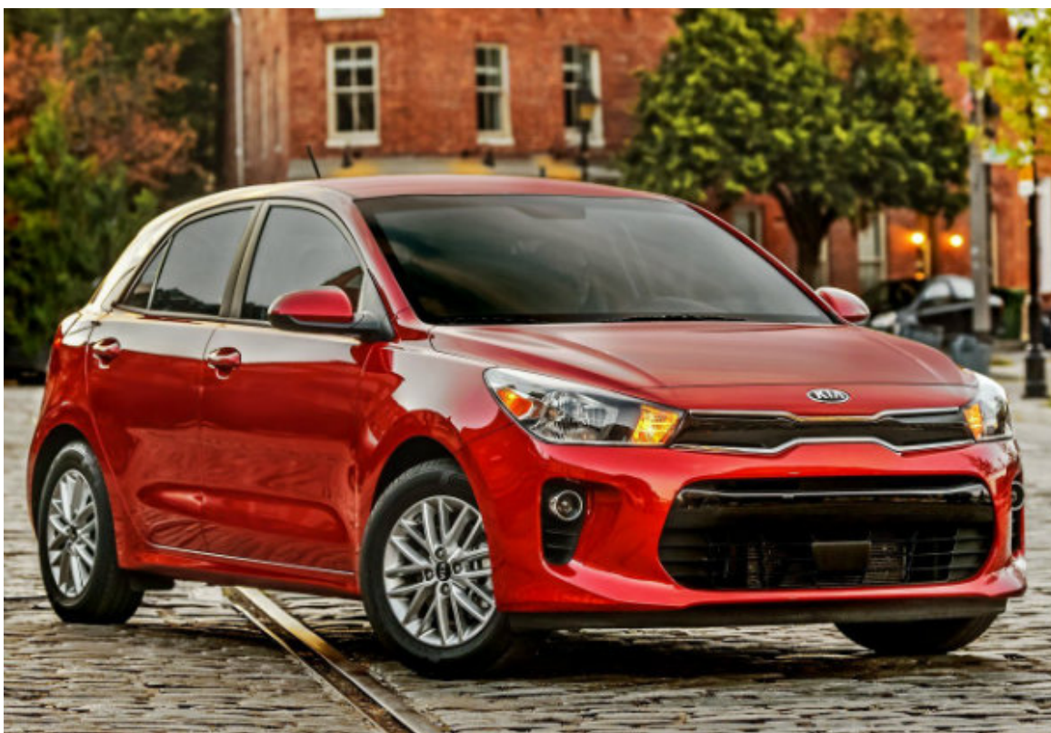
کیا ریو قبل از فیس‌لیفت

اشاره کرد. همچنین این نسخه با دو رنگ جدید و رینگ‌های 16 اینچی هشت پره با طراحی زیبا قابل انتخاب خواهد بود.