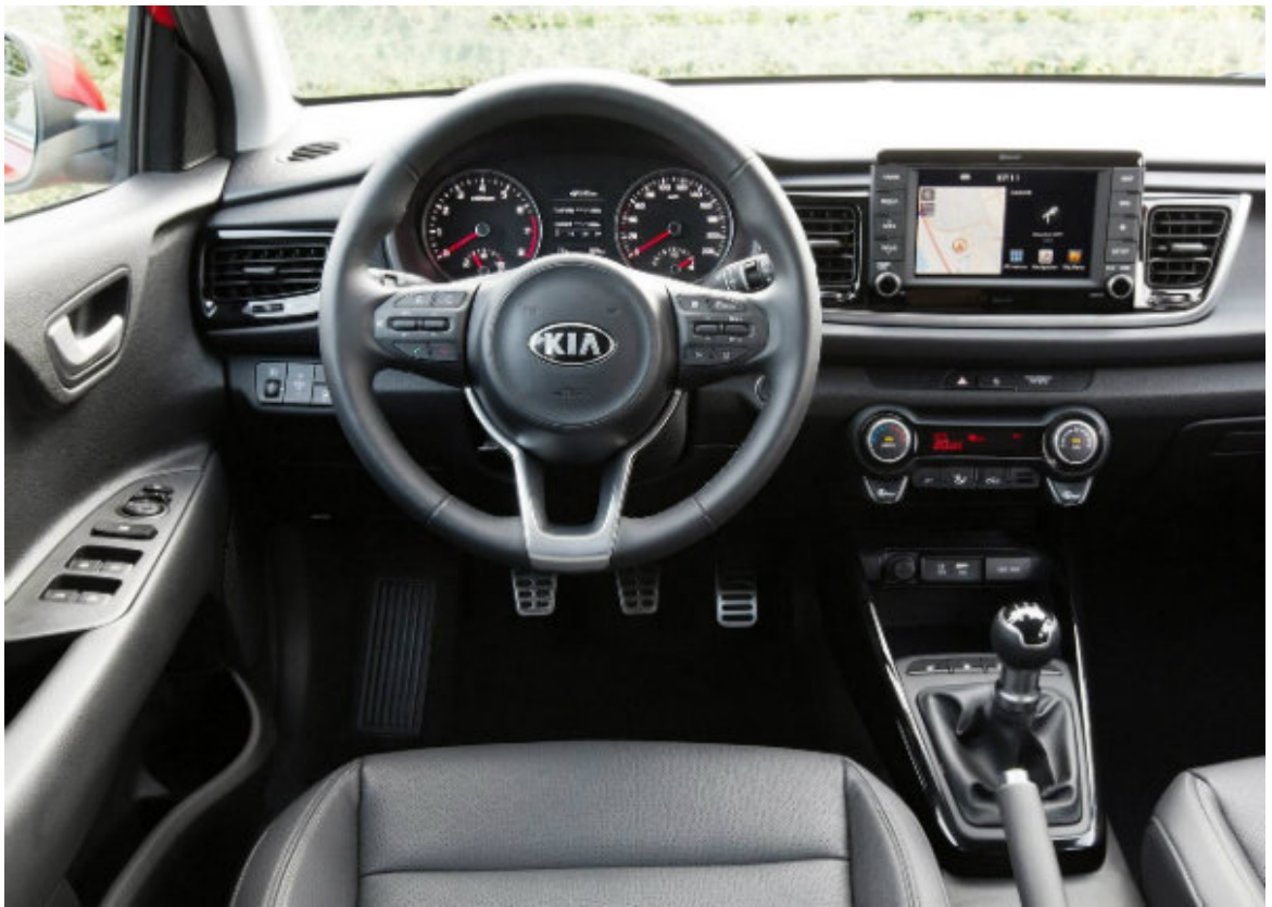
کابین ریو قبل از فیس‌لیفت

و نصب صفحه دیجیتال 4.2 اینچی با کیفیت‌تر در پشت فرمان شاخص‌ترین تغییرات فضای داخلی هستند. کیا برای خریداران ریو 2021 امکان سفارش رنگ‌های متنوع و شخصی‌سازی قسمت‌های مختلف کابین را فراهم کرده است.