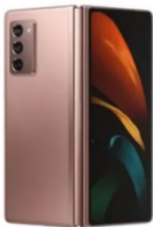
Samsung Galaxy Z Fold 2

نتایج بنچمارک DxOMark وان پلاس نورد نشان می‌دهد این گوشی هوشمند با کسب امتیاز کلی 108، در بخش عکاسی امتیاز 117 را از آن خود کرده است که امتیازی بالاتر از گوشی تاشوی سامسونگ است. شیائومی می 10 نیز با کسب امتیاز 110 از گلکسی زد فولد 2 پیشی گرفته است.