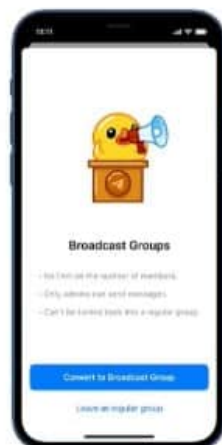
Unlimited Group Members