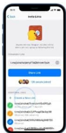
New Invite Links

کاربران به منظور فعال کردن این قابلیت، کافی است پیام مربوطه را انتخاب کرده، گزینه select و سپس Clear chat را انتخاب کرده و در نهایت گزینه Auto-Delete را فعال کنند. ویژگی حذف خودکار فقط پیام‌هایی که بعد از تنظیم تایمر ارسال شده باشند را به صورت خودکار حذف می‌کند. شمارش معکوس برای حذف پیام از زمان ارسال پیام در نظر گرفته می‌شود و زمان مشاهده پیام را لحاظ نمی‌کند.