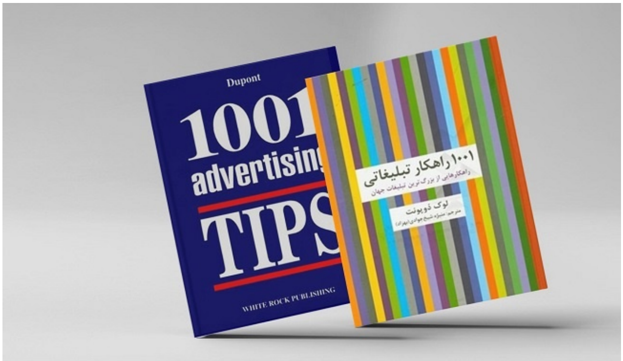
کتاب 1001 راهکار تبلیغاتی

متخصصان حوزه تبلیغات عقیده دارند که تمام استراتژی‌های لازم برای موفقیت در یک کسب‌وکار از جمله تخصص و دانش کافی، انگیزه، پشت‌کار و مدیریت اصولی در یک کفه ترازوی موفقیت قرار دارند و تبلیغات موثر و صحیح در کفه دیگر آن. لوک دوپونت در کتاب 1001 راهکار تبلیغاتی، صفر تا صد دنیای تبلیغات را برای شما تشریح و باید‌ها و نبایدهای این حوزه را در مجموعه‌ای کامل معرفی می‌کند. همچنین دوپونت ضمن بیان سرگذشت برندهای معتبر و نام‌دار جهان، پیروزی‌ها و شکست‌هایی که در عرصه تبلیغات تجربه کرده‌اند را به دقت تحلیل می‌کند. تبلیغات صحیح می‌تواند کسب‌وکار کوچک شما را به برندی قابل اعتماد و معروف بدل سازد و در مقابل بی‌توجهی به آن می‌تواند برندی مشهور را زمین‌گیر و ورشکسته کند؛ بنابراین در کنار توجه به سایر عوامل موثر در موفقیت، مطالعه کتاب‌های آموزش‌محور در شاخه تبلیغات را نیز جدی بگیرید.